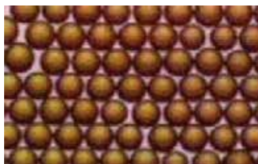
Resina Fine Mesh de alto rendimiento